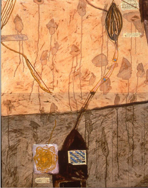
Kuva 6 Jan Kenneth Weckman, Imago, n 115 x 90 cm, n 1984 (Teos on muistaakseni Kuntsin taidemuseon kokoelmassa)

Guassin hallitsema sekatekniikka on säilyttänyt piirustuksen ja maalauksen vaivattomalta ja siksi hyvältä tuntuvan yhdistelemisen ilon, joka taitaa nousta esille kontrastin eli vastakkaisen tai eroja korostavan muotokielen voimasta. Sekatekniikat ovat etupäässä vesiliukoisten ja kuivien tekniikoiden yhdistämisen tulosta. Tämä tarkoittaa nopeata viivojen (kynät, liidut, pastellit) yhdistämistä pintaan (guassi, vesiväri, pigmentti, kollaasi). Sekatekniikka paperilla näin toteutettuna kuivuu nopeasti ja mahdollistaa kerroksittain etenevän spontaanin työtavan. Toki akvarelli ja "yhden" materiaalin tekniikat ovat yksinkertaisempia ja siksi nopeampia. Öljymaalauksen hitaus ja suurempi koko vie kauas guassin, akvarellin, pastellien ja kynien lähimaisemasta. Öljymaalauksissani on silti myös sellaisia piirteitä, jotka on mahdollista nähdä ikään kuin pienimuotoisena ja alkuvaiheessaan guassimaalauksessa. Hyppäys kahden tekniikan välillä ei ole helppoa, joten olenkin joutunut valitsemaan kahden työtavan välillä. Koska kuvittelen tuntevani paperilla maalauksen ja piirustuksen läpikotaisesti –