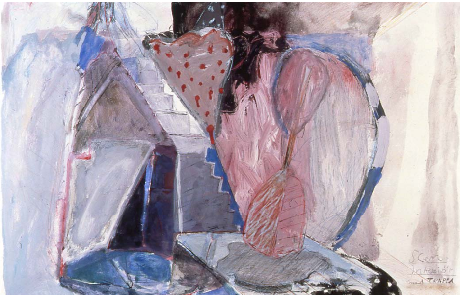
Kuva 10 Jan Kenneth Weckman: Näyttämö, n 42x65 cm guassi, hiili, vesiväri, pastelli, 1984

Tosin kapeiden vaakamuotoisten guassien nimet on taidekauppias itse keksinyt. Ne kuuluvat kaikki sarjaan, jota kutsun Tunteellinen matka, Sentimental resa. Niitä on pitkälti toistakymmentä kaiken kaikkiaan. Alkuperäinen rakennusten fantasiat tulevat mustavalkoisesta piirustuksesta, joita aloin 1980-luvulla tehdä tällä guassi- ja sekatekniikalla.