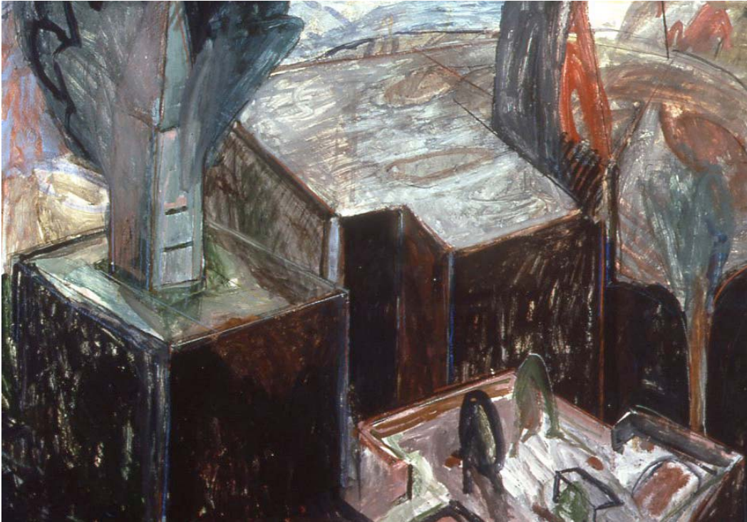
Kuva 9 Jan Kenneth Weckman, Puutarha, sekatekniikka paperille, n 52 x 65 cm, 1984 (Teos on Turun taidemuseon kokoelmassa)

Teos tehdään paperille, joka kestää työskentelyn erilaiset vaiheet. Siksi paperin on oltava vahva, esim. Yli 200g/m 2 paksuista, mielusti vaikka 300 g/m 2 . Tekstuuri tulisi olla kohtalaisen sileä. Mitä kuvioidumpi tekstuuri, sitä enemmän se vaikuttaa ilmaisuun. Tällaista efektiä tavoitellaan useimmiten akvarelleissa. Nyt on tarkoitus pinnoittaa eli pohjustaa paperi guassilla, ennen muuta työskentelyä. Sitä ennen se on kiinnitettävä alustalle, mielusti lastulevylle johon niittaamalla paperi tarttuu tiiviisti kiinni. Pelkkä teippaus lastulevylle irtoaa melko nopeasti, jopa muutamassa tunnissa. Mitä sileämpi pinta, sitä paremmin teippi kiinnittyy. Mutta sileä kova levypinta ei ota vastaan niittejä helposti. Ne jäävät irti. Lastulevy, n 8 mm-16 mm, on tarpeeksi halpa ja pinnaltaan helppo käyttää alustana. Yksi rasite on lastulevyn paino. Miten isoja piirustuksia on tarkoitus tehdä? Tavallisesti järkevän koon raja menee reilun metrin kohdalla, esimerkiksi 120-130 x 90-100 cm kohdalla. Sen ylimenevät levyt ovat painavia, ellei pääty tekemään